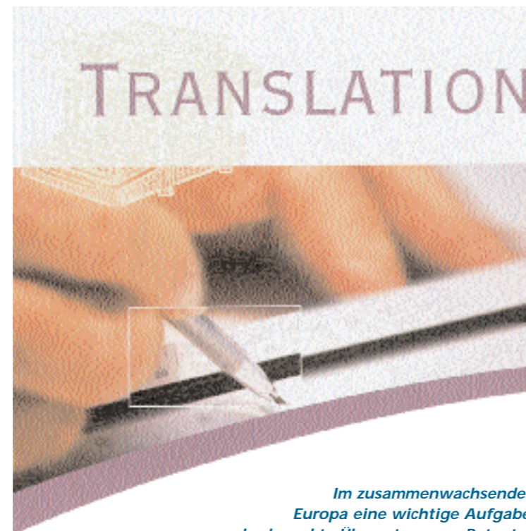
Im zusammenwachsenden Europa eine wichtige Aufgabe: das korrekte Übersetzen von Patenten